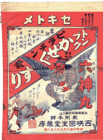
◀天狗に鬼が追われている絵が描かれている 大きな配置薬の預け袋(縦30.5cm・横22.5cm)