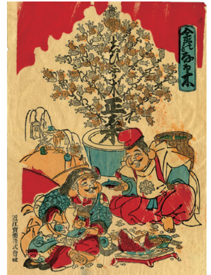
金のなる木。慈悲深き、正直、いさぎよき、養生よき、辛抱強きなどの枝に小判の葉っぱが生っています。