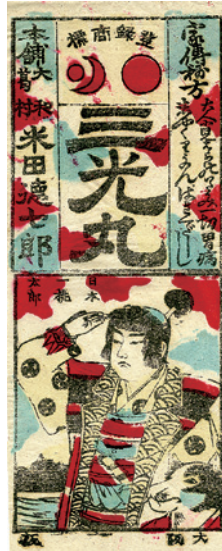
桃太郎ですが、お供は犬だけです。

この「薬 Art gallery」シリーズ第一展示室ではマッチをこ紹介しました。その中でかつて売薬行商人たちはおみやげとして「紙風船」をよく用いたことに触れました。置き薬屋さんがある文字や絵(が書いてある)「縁起のよいもの(がデザインされている)」などが満たされていることが大事ですが、今回取り上げました「売薬版画」も「紙風船」と共にそのような条件にマッチするおみやげアイテムの一つとして多用されました。「売薬版画」は富山絵・おまけ絵・絵紙なども呼ばれ、その始まりは江戸時代後期にさかのぼるようです。今回ご紹介する「売薬版画」は明治期に印刷された2〜3色からなる木版や石版刷りの素朴なもので、この素朴な色調と図柄が「売薬版画」の魅力だと思います。