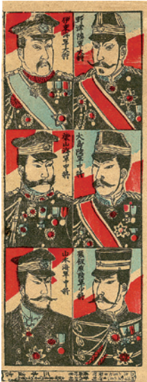
日露戦争当時の軍人さん。左上段は初代の連合艦隊司令官伊東祐亨提督(明治39年(1906年)製)