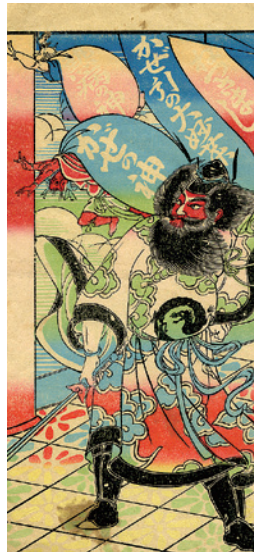
かぜの神、熱病の神を追い払う鍾馗様の図柄