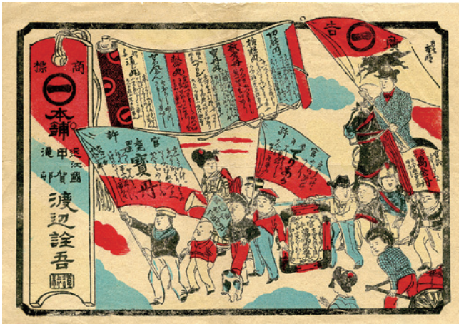
薬の宣伝パレードの図柄