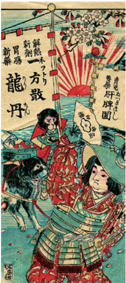
桃太郎ですが、お供の雉がいません。

この「薬 Art gallery」シリーズ第一展示室ではマッチをこ紹介しました。その中でかつて売薬行商人たちはおみやげとして「紙風船」をよく用いたことに触れました。置き薬屋さんがある文字や絵(が書いてある)「縁起のよいもの(がデザインされている)」などが満たされていることが大事ですが、今回取り上げました「売薬版画」も「紙風船」と共にそのような条件にマッチするおみやげアイテムの一つとして多用されました。「売薬版画」は富山絵・おまけ絵・絵紙なども呼ばれ、その始まりは江戸時代後期にさかのぼるようです。今回ご紹介する「売薬版画」は明治期に印刷された2〜3色からなる木版や石版刷りの素朴なもので、この素朴な色調と図柄が「売薬版画」の魅力だと思います。