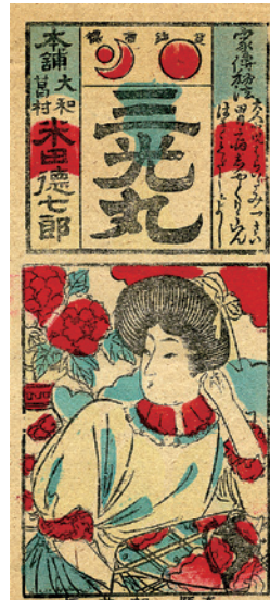
奈良の売薬「三光丸」と婦人